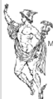
HERMES MENSAJERO DE LOS DIOSES