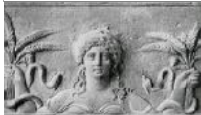
DEMÉTER DIOSA DE LA TIERRA CULTIVADA