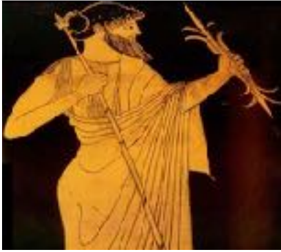
ZEUS EL DIOS SUPREMO