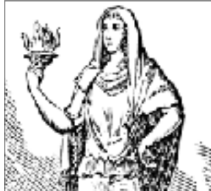
HESTIA DIOSA DEL HOGAR