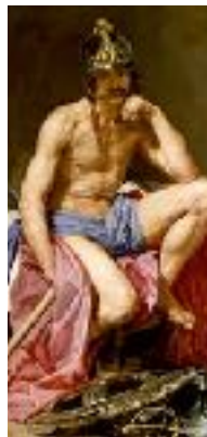
ARES DIOS DE LA GUERRA