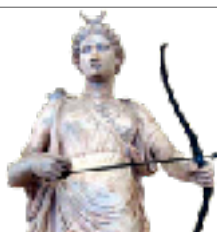
ÁRTEMIS DIOSA DE LA CASTIDAD Y LA CAZA