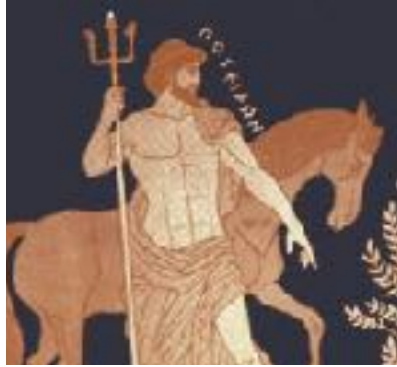
POSIDÓN EL DIOS DEL MAR