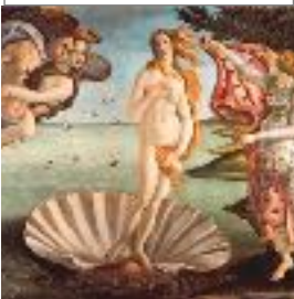
AFRODITA DIOSA DEL AMOR Y LA BELLEZA