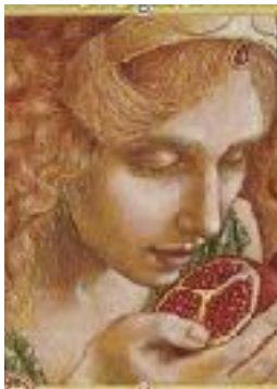
PERSÉFONE DIOSA DEL MUNDO DE LOS MUERTOS