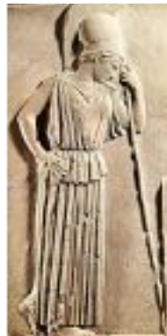
ATENEA DIOSA DE LA SABIDURÍA Y DE LA DESTREZA