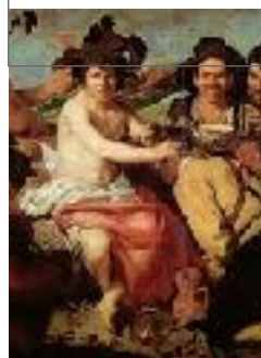
DIONISO DIOS DEL VINO Y TEATRO