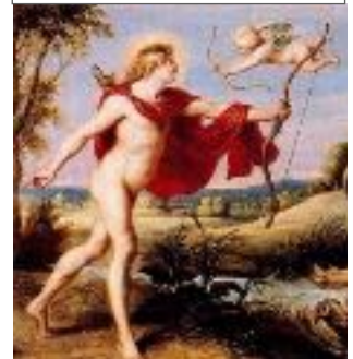
APOLO DE LA MEDICINA, LAS ARTES Y LA ADIVINACIÓN